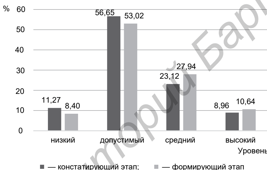
Рисунок 3. — Распределение по уровням сформированности практико-ориентированной математической цифровой компетентности в контрольной группе в начале и конце эксперимента

Оценка методической системы практико-ориентированного обучения математике будущих инженеров с использованием статистических методов подтвердила ее эффективность. В сравнении с контрольным этапом эксперимента количество обучающихся с высоким и средним уровнями сформированности практико-ориентированной математической компетентности в экспериментальной группе увеличилось на 24,96 и 14,74 % соответственно, в то время как в контрольной группе прирост составил 4,82 и 1,68 %. Полученные результаты были проанализированы с помощью статистических методов, включая критерий \chi^2 , и дополнительно проверены с использованием программы STATTECH. Данные представлены на рисунках 3 и 4.