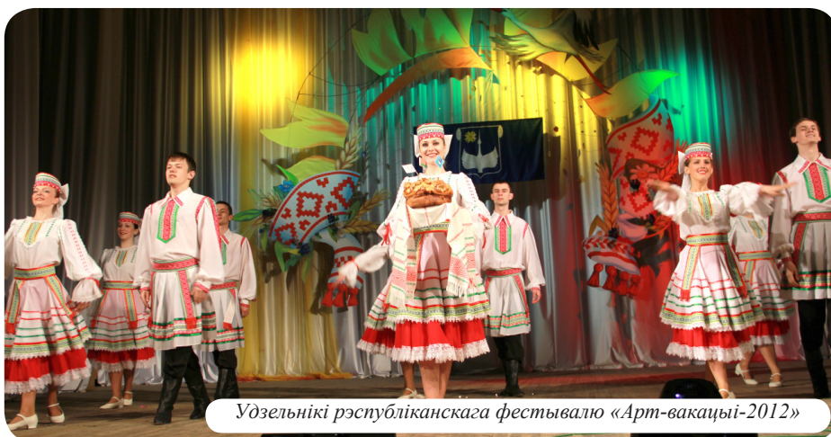
Удзельнікі рэспубліканскага фестывалю «Арт-вакацыі-2012»

Развіваць традыцыі ўніверсітэта, фарміраваць карпаратыўную свядомасць, палікультурнае мысленне дапамагаюць папулярныя творчыя праекты «Таленты