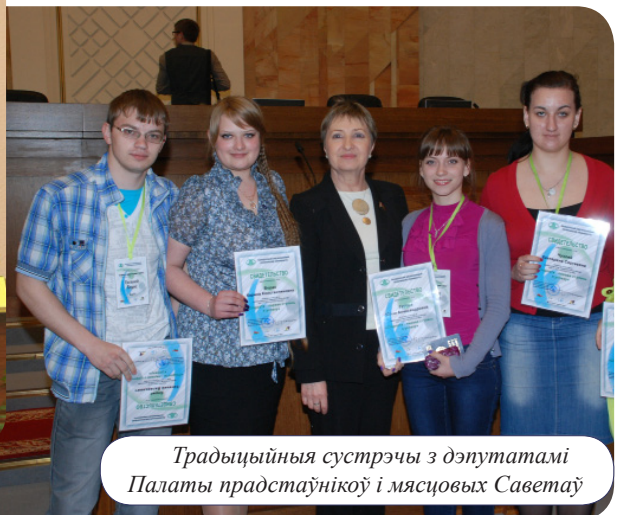
Традыцыйныя сустрэчы з дэпутатамі Палаты прадстаўнікоў і мясцовых Саветаў