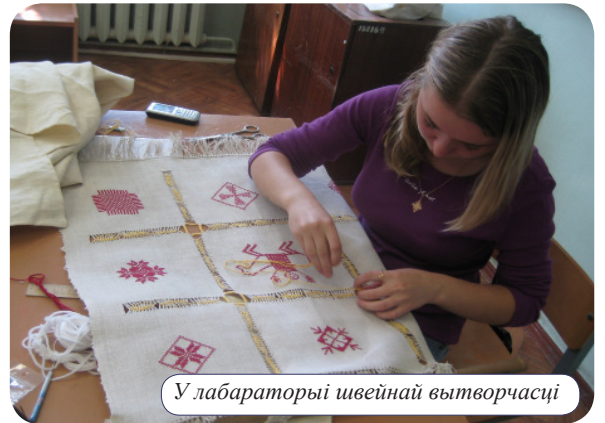
У лабараторыі швейнай вытворчасці