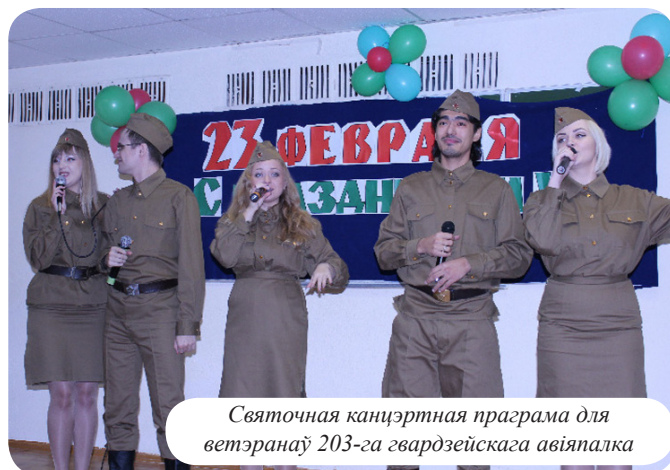
Святочная канцэртная праграма для ветэранаў 203-га гвардзейскага авіяпалка