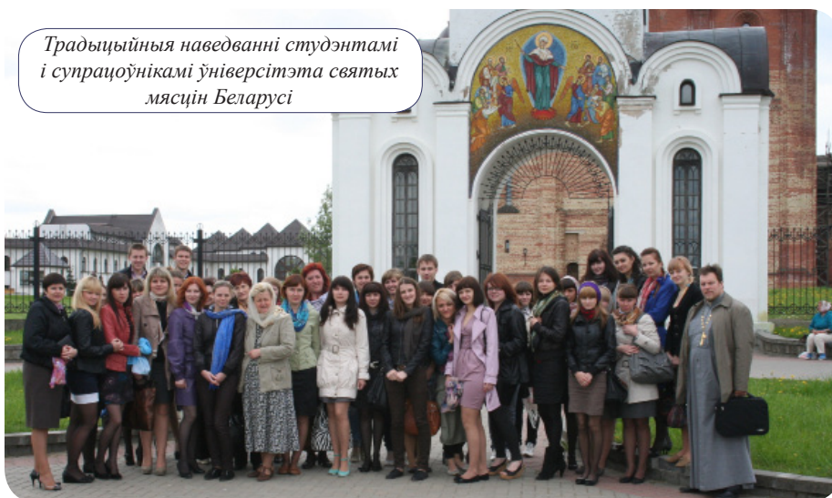
Традыцыйныя наведванні студэнтамі і супрацоўнікамі ўніверсітэта святых мясцін Беларусі