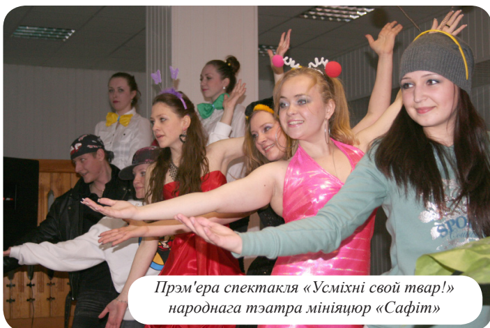
Прэм'ера спектакля «Усміхні свой твар!» народнага тэатра мініячур «Сафіт»