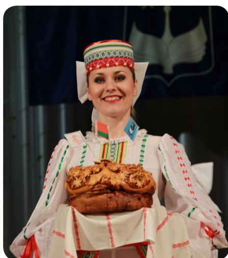
Шчырае вітанне гасцей БарДУ