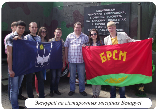
Экскурсії па гістарычных мясцінах Беларусі