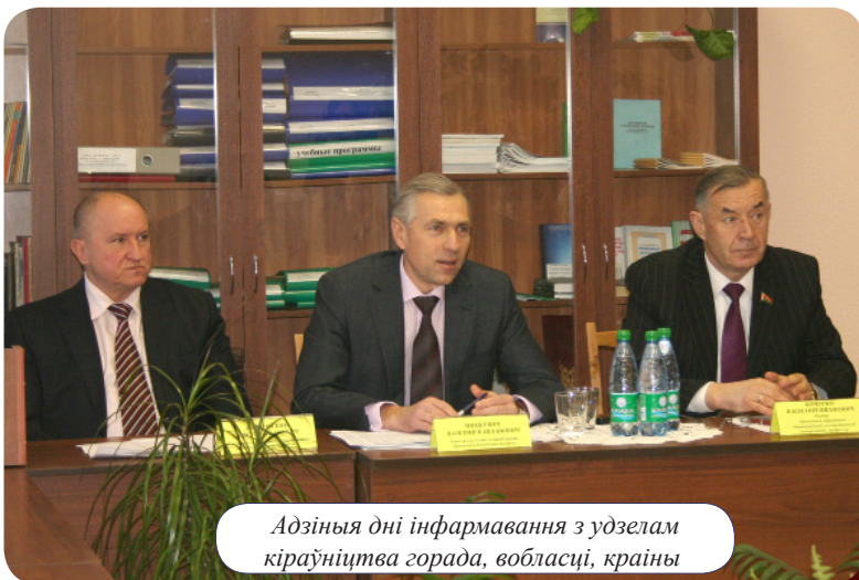
Адзіныя дні інфармавання з удзелам кіраўніцтва горада, вобласці, краіны