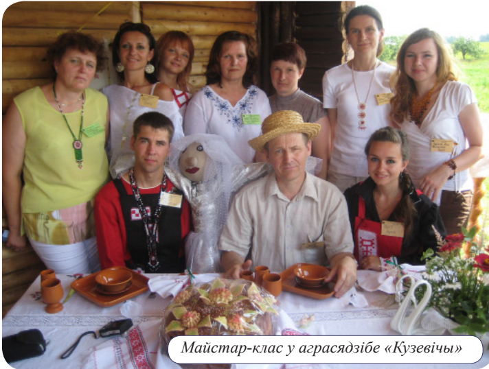
Майстар-клас у аграсядзібе «Кузевічы»