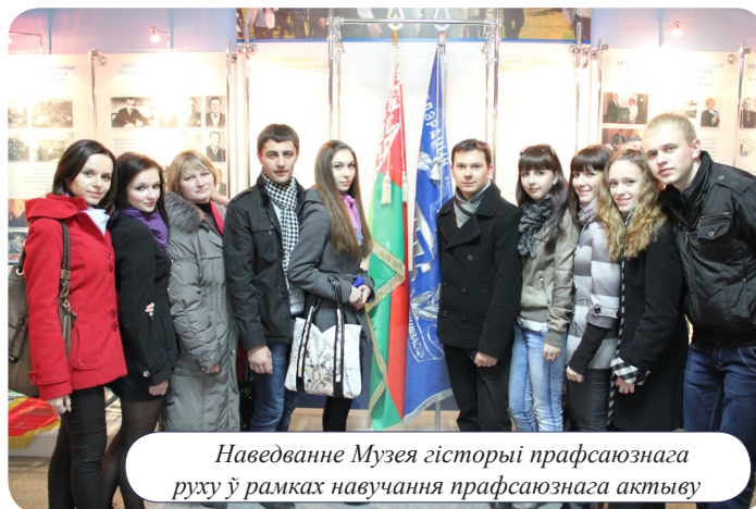
Наведванне Музея гісторыі прафсаюзазнага руху ў рамках навучання прафсаюзазнага актыву