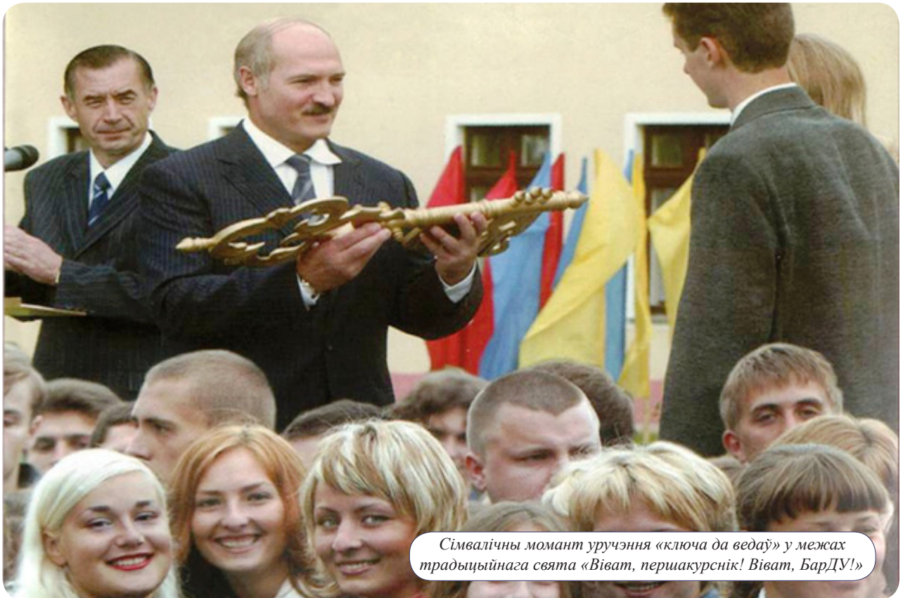
Сімвалічны момант уручэння «ключа да ведаў» у межах традыцыйнага свята «Віват, першакурснік! Віват, БарДУ!»