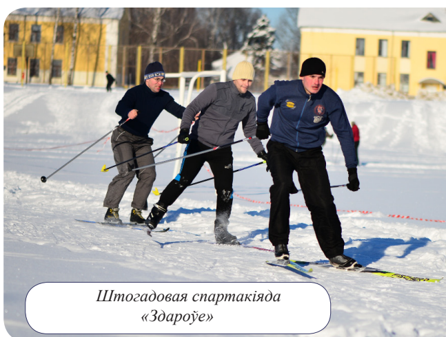
Штогадовая спартакіяда «Здароўе»