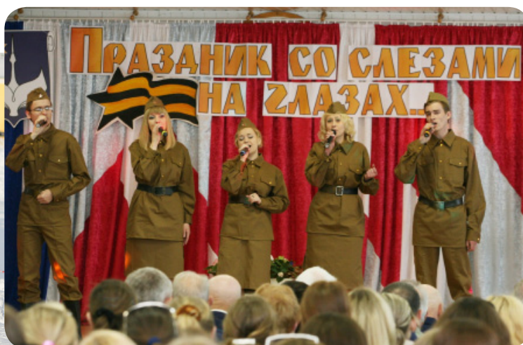
Штогадовы святочны канцэрт, прысвечаны Дню Перамогі