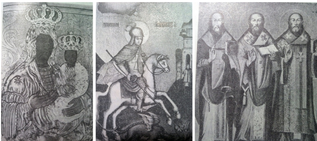
Рысунак 2 — Царкоўныя абразы Свята-Духава храма XVII ст.: Божая Маці Падлеская, «Суд Юрыя», «Тры Свяціцелі» [10]