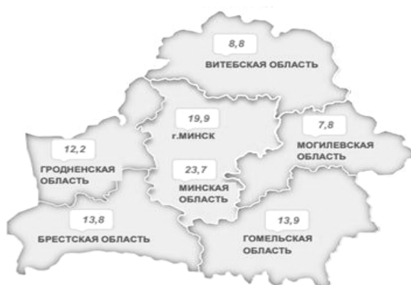
Рисунок 1 — Удельный вес областей и г. Минска в республиканском объёме инвестиций в основной капитал, % [1]

Наиболее востребованными сферами для инвестиций в Республике Беларусь являются недвижимость и обрабатывающая промышленность. На иностранные инвестиции приходится малая доля, в связи с введением санкционных мер в отношении Республики Беларусь (рисунок 3).