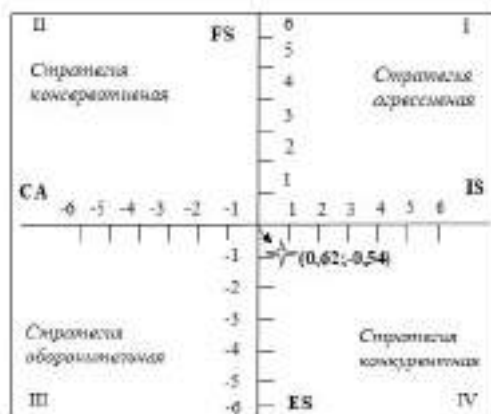
Рисунок 1. — Стратегическая позиция развития инвестиционной активности Брестской области

– специализация — сельское, лесное и рыбное хозяйство; горнодобывающая промышленность; транспортная деятельность, складирование, почтовая и курьерская деятельность; операции с недвижимым имуществом; образование; здравоохранение и социальные услуги;