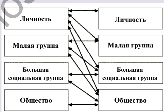
Рисунок 1 — Объекты исследования в социальной психологии

В зависимости от того или иного понимания предмета социальной психологии выделяются основные объекты её изучения, т. е. носители социально-психологических явлений. Наиболее полно объекты социальной психологии, включая и те, которые ещё недостаточно изучены, можно представить в виде схемы (рис. 1).