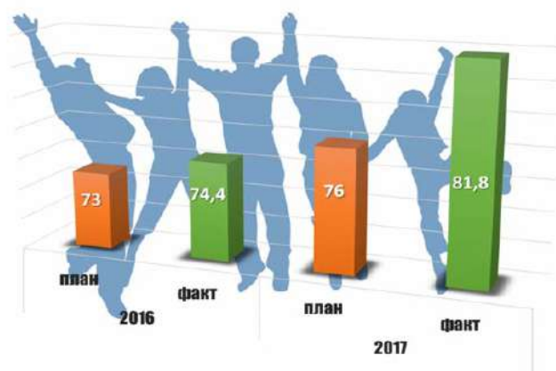
Рисунок 2 — Охват молодежи мероприятиями в сфере молодежной политики и патриотического воспитания, % [4]

В связи с проведением большого количества мероприятий патриотической направленности увеличивается охват молодежи мероприятиями в сфере молодежной политики и патриотического воспитания (рисунок 2).