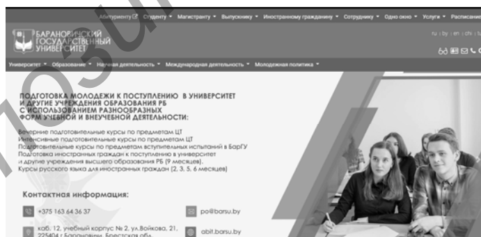
Рисунок 2 — Сайт Барановичского государственного университета

Синий цвет используют такие компании, как: LinkedIn, Skype ну и многие сайты в сфере образования. На рисунке 2 представлена главная страница официального сайта Барановичского государственного университета, которая выполнена в синих и васильковых тонах.