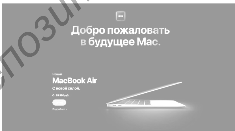
Изображение 4 — Сайт IT-компании Apple

На рисунке 4 представлена главная страница сайта компании Apple.