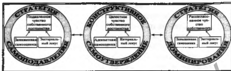
Рисунок 1 - Существенная характеристика стратегий самоутверждения

В диссертации обоснованы факторы, препятствующие формированию готовности к конструктивному самоутверждению: неудовлетворенность социодетальных потребностей в школьные годы; неконструктивность детско-родительских отношений; несформированность целостного чувства собственного достоинства, социальных умений и экзистенциальных способностей; усиление отрицательных особенностей характера воспитанника. С помощью включённого наблюдения, социометрии, диагностики характерологических проявлений Г.Ю. Айзенка, методики «Стратегии самоутверждения личности» Е.П. Никитина и Н.Е. Харламенковой был выделен развивающий потенциал отрицательных стратегий самоутверждения, на который следует опираться при формировании готовности к конструктивному самоутверждению.