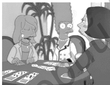
Рисунок 2 — Анимационный телесериал “The Simpsons”, 7 сезон, 14 серия