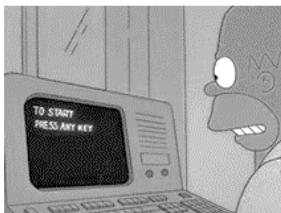
Рисунок 4 — Анимационный телесериал “The Simpsons”, 7 сезон, 7 серия