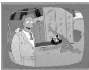
Рисунок 1 — Анимационный телесериал “The Simpsons”, 7 сезон, 11 серия

В приведенной сцене (рисунок 3) омофонический каламбур реализуется в названии комедийного шоу “ BREW HA HA! ”. Надпись на вывеске питейного заведения созвучна слову “brouhaha” («сильный шум или недовольные возгласы по поводу чего-либо»), а лексема “brew”, входящая в ее состав, имеет значение «заваренный напиток». Каламбур выводится в фокус внимания зрителей посредством графических (крупный план, свет) и типографических средств (прописные буквы). Функционально каламбур служит для поддержания юмористического тона телесериала.