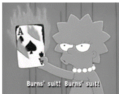
Рисунок 5 — Анимационный телесериал “The Simpsons”, 7 сезон, 1 серия