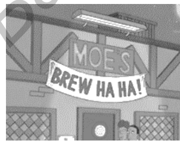
Рисунок 3 — Анимационный телесериал “The Simpsons”, 9 сезон, 15 серия