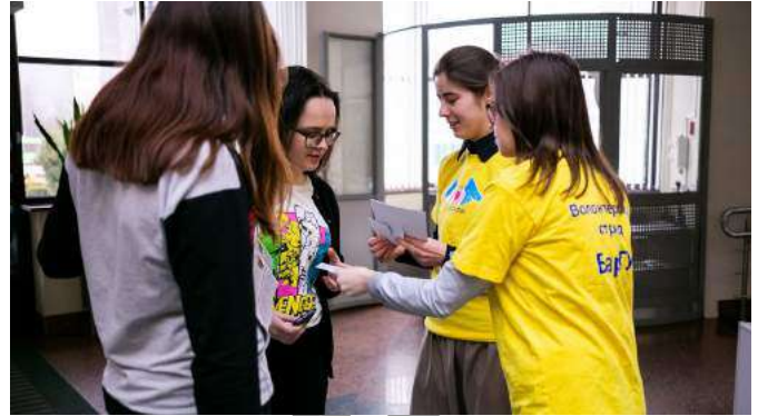
Распространение буклетов «За жизнь без наркотиков!»

Немедицинское применение наркотических веществ приобретает массовый характер, что становится социально опасным (рост преступности, несчастные случаи и самоубийства, тяжелые проблемы со здоровьем и здоровьем будущего потомства, уменьшение продолжительности жизни, проституция, распространение ВИЧ-инфекции, гепатита С и др.).