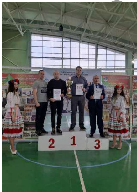
Награждение за 1-е место сборной команды БарГУ

29 марта на базе учреждения образования «Барановичский государственный университет» прошли республиканские соревнования по армрестлингу среди юниоров и юниорок 1999 года рождения и моложе.