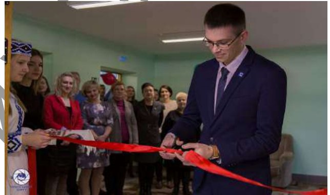
Торжественное открытие уголка белорусской культуры

Республика Беларусь имеет богатое духовное наследие. Оно формировалось на протяжении веков и передавалось из поколения в поколение. Их сохранение — наиболее эффективное средство национального развития, создания полноценных условий совершенствования личности. Культура народа выступает мерой его духовности, цивилизованности, этнического своеобразия. Духовные ценности, утверждаемые и развиваемые обществом, являются почвой, предпосылкой формирования национального самосознания, национальной идеи.