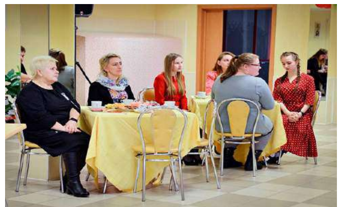
Фрагменты вечера встречи «Незатухающее эхо войны»