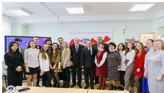
Участники круглого стола «Беларусь и Китай: многовекторность сотрудничества»