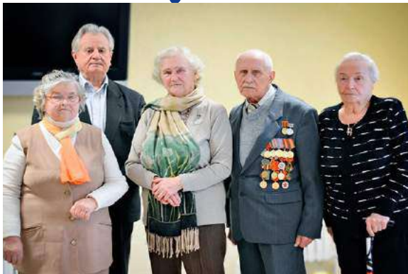
Ветераны Великой Отечественной войны

В рамках марафона молодёжных инициатив «Великой Победе в благодарность!» в БарГУ состоялась встреча с ветеранами Великой Отечественной войны.