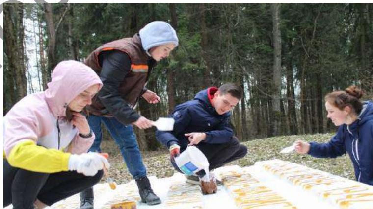
Студенты инженерного факультета — участники акции по благоустройству мемориального комплекса «Урочище Гай»

Вот такой вклад внесли студенты инженерного факультета БарГУ в благодарность Великой Победе!