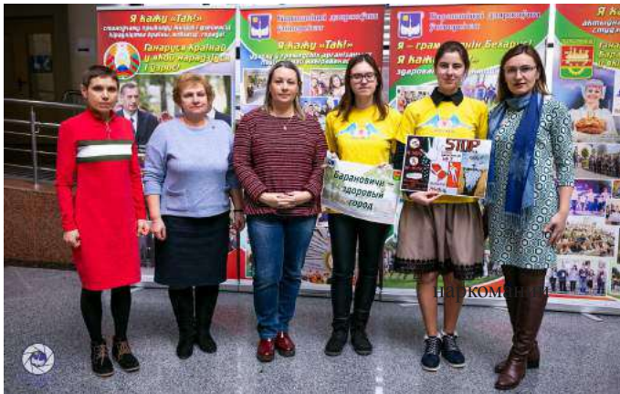
Организаторы акции «За жизнь без наркотиков!»

Специалисты и волонтеры отряда «Крылья надежды» в очередной раз напомнили молодым людям, что проблема