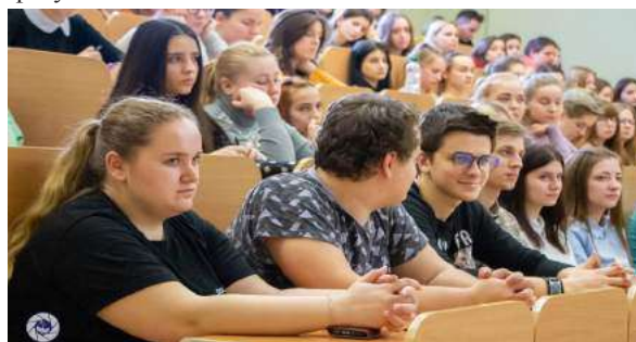
Фрагмент образовательного семинара «Роль женщины в современном мире»