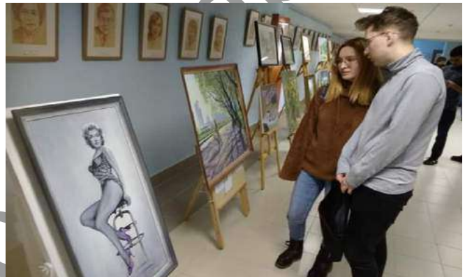
Посетители выставки — студенты БарГУ

Яркая и неординарная личность художника впечатлила молодёжь, многие с увлечением рассматривали картины, составившие экспозицию выставки.