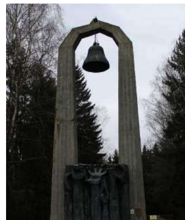
Центральный памятник мемориального комплекса «Урочище Гай» — 12-метровая арка с колоколом

К молодежному марафону инициатив «Великой Победе в благодарность!» присоединился студенческий совет инженерного факультета. Молодёжь решила выразить свое почтение и сказать «спасибо» людям войны. Студенты БарГУ убрали и облагородили территорию мемориального комплекса «Урочище Гай» в Барановичах.