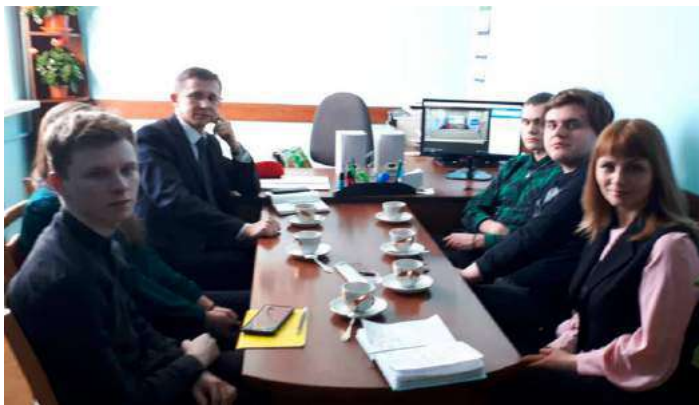
Участники старта глобальной инициативы «ООН-75 / UN75» от БарГУ

Сам проект предусматривает обмен опытом по достижению целей устойчивого развития, проведение региональной дискуссии «Глобальный разговор о будущем мира», реализацию молодежных проектов.