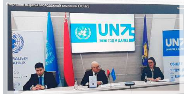
Онлайн-трансляция церемонии начала программы «ООН75 / UN75»

Учреждение образования «Барановичский государственный университет» в этом международном проекте будет выполнять функцию регионального координационного центра. В проекте кроме университетов будут участвовать школы региона, которые являются ресурсными центрами по устойчивому развитию. В Барановичах это средняя школа № 7, школы, в которых имеются профильные педагогические классы.