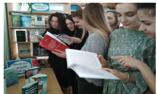
Студенты БарГУ знакомятся с новыми научными изданиями