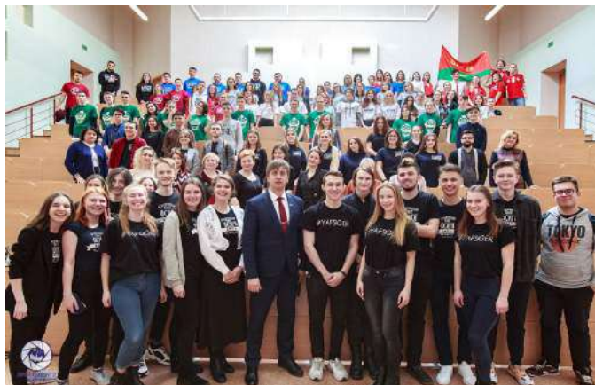
Участники диспута «Оптимальная пропорция «Я—МЫ—ОНИ»»

Одной из образовательных площадок, где участники форума «оттачивали» навыки ораторского мастерства, стал диспут «Оптимальная пропорция «Я—МЫ—ОНИ» в борьбе с вызовами современного поликультурного мира». От депутата Палаты представителей Национального собрания Республики Беларусь седьмого созыва Павла Ивановича Попко присутствующие узнали о важности правильной постановки речи, затем им было предложено придумать решение определенной проблемы в формате «Я—МЫ—ОНИ».