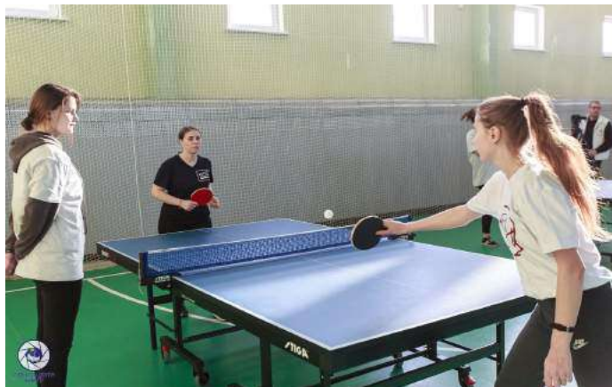
Фрагмент конкурса «Спортивный рывок»