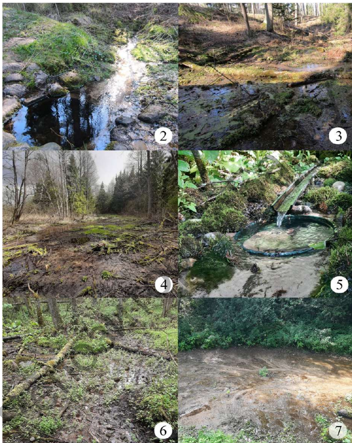
Рисунки 2—7. — Родниковые экосистемы Барановичского района (I): 2 — родниковый комплекс Тартаки (лимнокрен); 3 — родниковый комплекс Тартаки (гелокрен); 4 — родник Тартаки-Катихин; 5 — родник Басины-Лесной; 6 — родник в окрестностях д. Добрый Бор; 7 — родник Мурованка-1