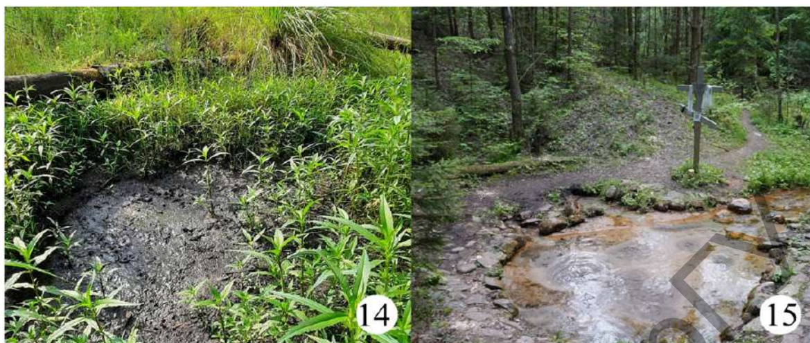
Рисунки 14—15. — Родниковые экосистемы Барановичского района (III): 14 — родник Мшанка; 15 — родник Ясенец