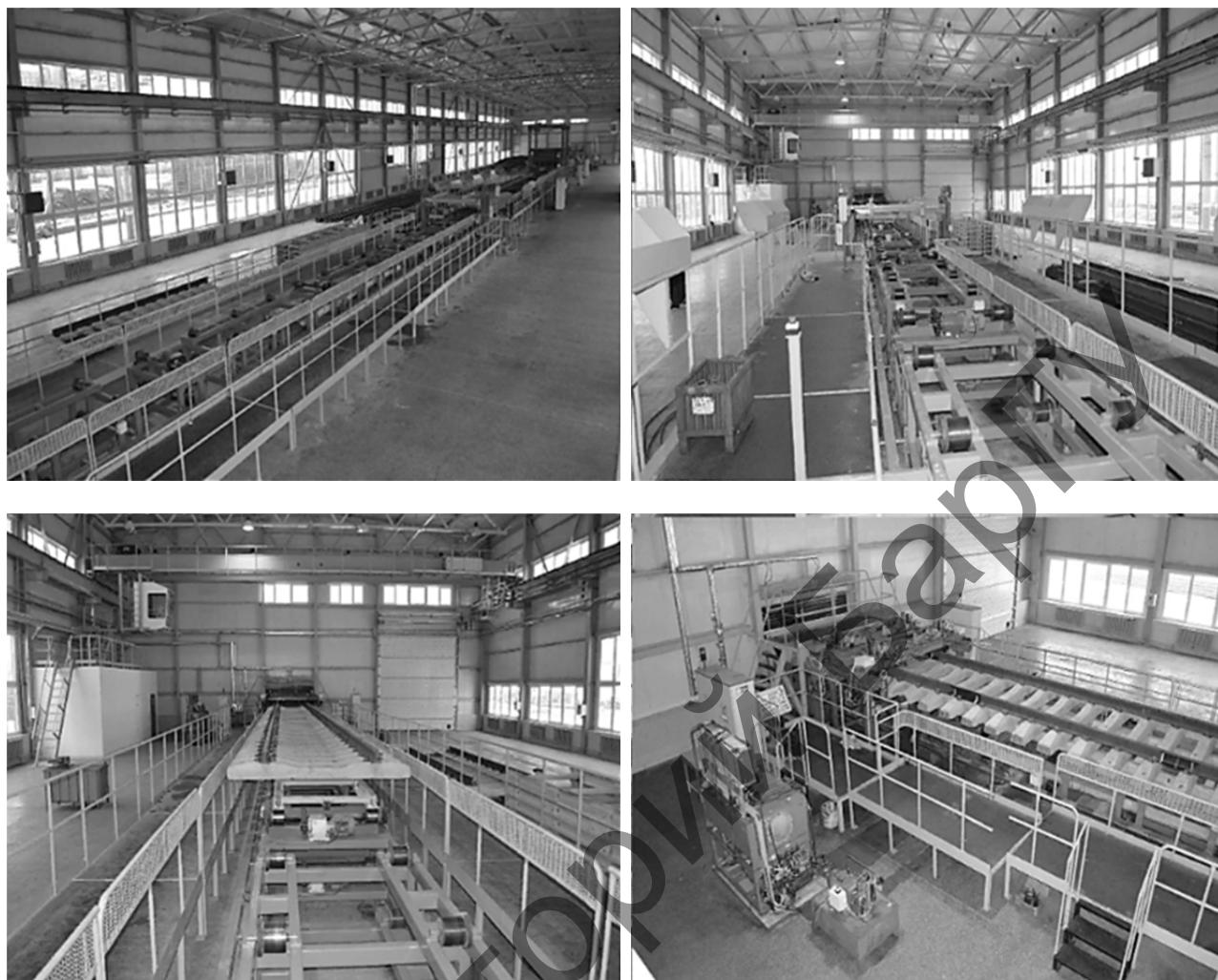
Рисунок 1. — Звеносборочная линия КБ03

Линия КБ03 предназначена для сборки звеньев РШР колеи 1 520 мм на рельсах типов Р65/Р50 со креплением СБ-3 и эпюрой 1 840/2 000 шпал / км. Линия представляет собой систему агрегатов, станков и механизмов, установленных в определенной технологической последовательности и связанных между собой межоперационными транспортирующими устройствами [1].