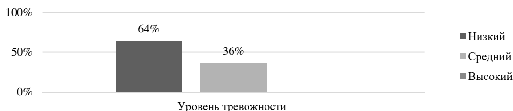
Рис. 1. Результаты исследования уровня тревожности у юношей

Результаты исследования уровня тревожности у юношей представлены на рисунке 1.