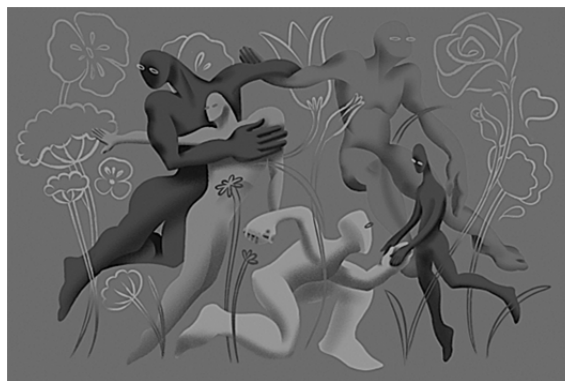
Рисунок 2. — «Ты не один»

Важной темой в программе формировании толерантности к беженцам является «Организация