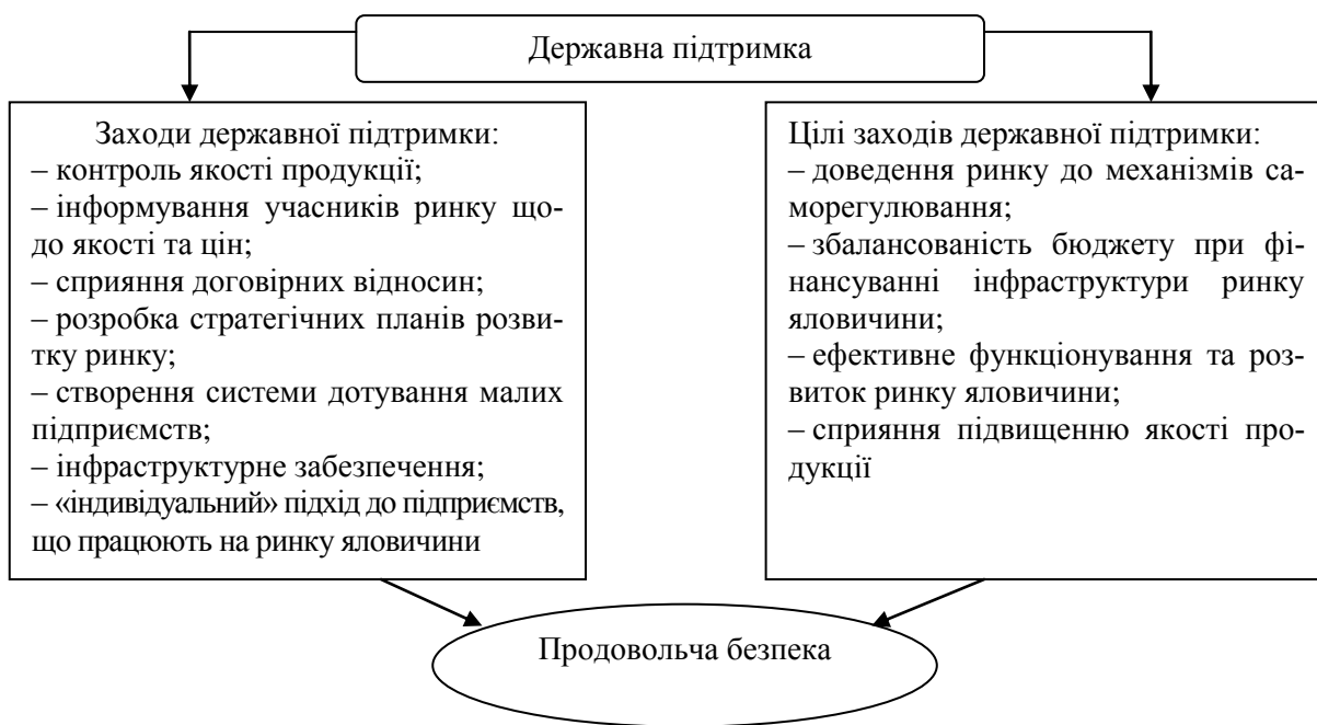
Рисунок 1. — Обґрунтування заходів державної підтримки ринку яловичини

Ідеологія державного регулювання та контролю ринку яловичини України лежить в сфері продовольчої безпеки держави. Створення нових організаційно-економічних відносин дозволить національній економіці проводити єдину державну політику на внутрішньому ринку яловичини, поповнити внутрішній ринок споживання даного виду продукції, забезпечити виробників усіма ресурсами, необхідними для нарощення виробництва, залучити необхідні інвестиції для відновлення та розвитку інфраструктури ринку.