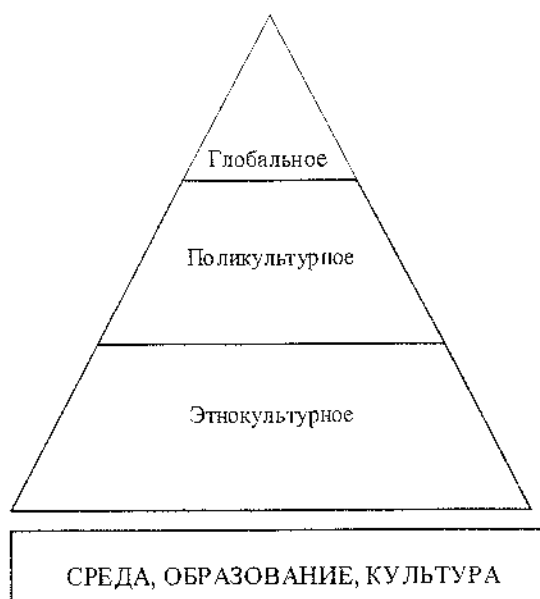
Рисунок 2 — Ступени образования в системе культурных концепций

Концепция этнокультурного образования, получившая распространение в странах СНГ