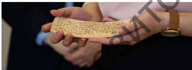
«Витебская берестяная грамота»