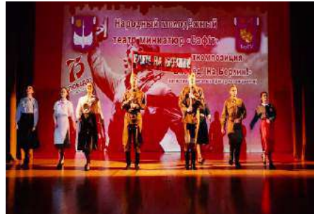
Народный молодёжный театр миниатюр «Сафіт»