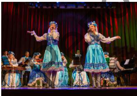
Народный инструментальный ансамбль «Музычны гасцінец»