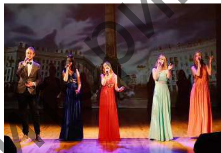
Народная студия эстрадной песни «Талент»