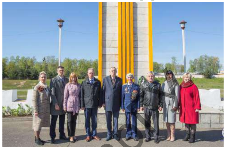
Участники церемонии возложения цветов к мемориалу