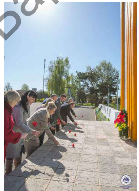
Церемония возложения цветов

Последние авиаудары в ходе войны полк наносил по Кенигсбергу.