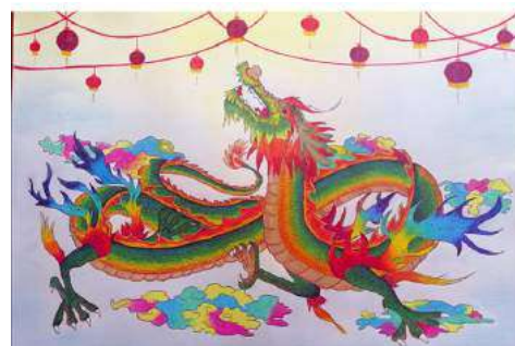
Рисунок «Китайский дракон» (автор А. Залеская)