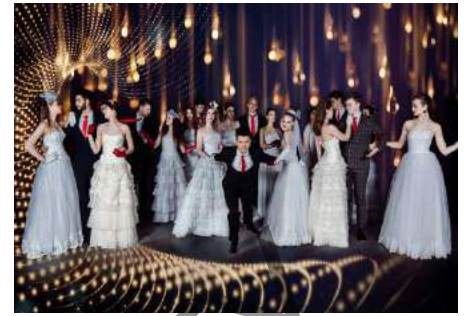
Народный театр моды «Світа»