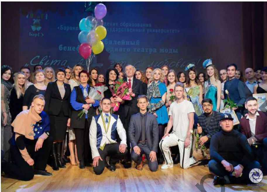
Юбилейный бенефис народного театра моды «Світа» (2019 год)

Премьерный показ первой сценической композиции театра моды «Світа» состоялся 24 апреля 1999 года. Именно эта дата считается днём рождения замечательного коллектива, сплотившего и объединившего в большую творческую семью не одно поколение талантливой студенческой молодёжи.