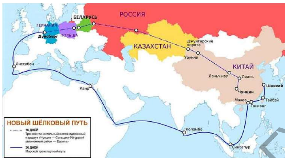
Рисунок 2 — Железнодорожная часть НШП [3]

Второй важнейший аспект темы в том, что 2021 г. — последний. Когда участники транзита из других стран (включая и БЖД) получали субсидии из Китая. В этих условиях прогнозируют возрастание роли России и ее логистических фирм. Россия планирует инвестировать около $12 млрд. в Транссибирскую и Байкало-Амурскую железные дороги, активно занимается модернизацией погранпереходов и их пропускной способности в Калининградской области и после завершения этого процесса возможно увеличение грузопотока на данном участке примерно в 10 раз.