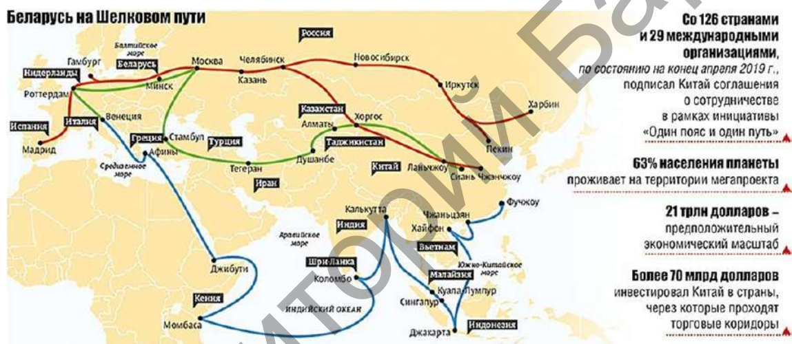
Рисунок 1 — Место Беларуси в проекте «Один пояс — Один путь» [2].

Беларусь, благодаря своему расположению в Европе, становится естественной участницей проекта (рисунок 1).