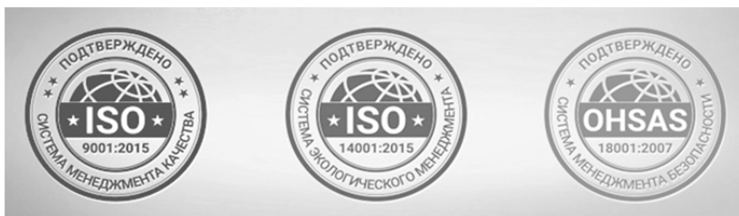
Рисунок 1 — Системы менеджмента качества, действующие в Республике Беларусь, соответствующие международным стандартам качества