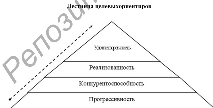
Рисунок 3 — Последовательность формирования целевых социально-экономических макро институциональных ориентиров посредством оптимизации профессионально-психологической сопряженности

Системная и сопряженная реализация комплекса предложенных мероприятий будет способствовать последовательному формированию макроинституциональных ориентиров. Пирамиду данных целевых ориентиров представим на рисунке 3.