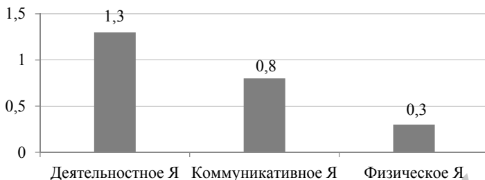
Рисунок 2 — Средние показатели наименее проявленных компонентов идентичности у юношей и девушек