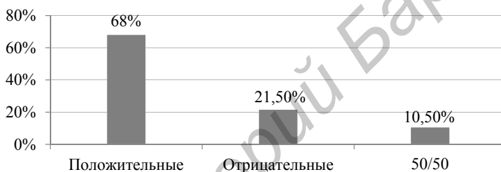
Рисунок 3 — Показатели общей самооценки идентичности у юношей и девушек

Заключение. Таким образом, можно сказать, что в юношеском возрасте преобладает средний уровень развития Я-концепции. Это говорит о том, что у юношей и девушек в меру развито защитное отношение к себе, оценка себя, своих возможностей и удовлетворенность собой в процессе взаимодействия в университете и в семье.