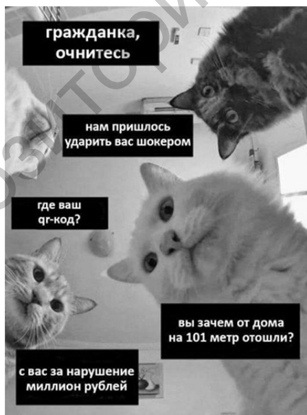
Рисунок 3 — Пример намека