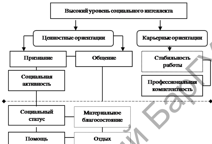
Рисунок 2 — Ценностные ориентации студентов-социальных педагогов с высоким уровнем социального интеллекта

обеспечивающих социальную убедительность [2]. Учитывая, что профессии «социальный педагог» и «практический психолог» предполагают взаимодействие с людьми по принципу не руководства, а личностного влияния, указанное обоснование приемлемо и в отношении рассматриваемых выборов.