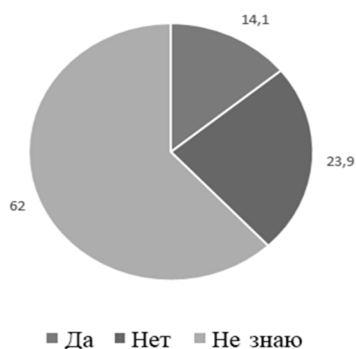
Рисунок 1 — «Испытывали ли Вы трудности в разрешении конфликтных ситуаций?»