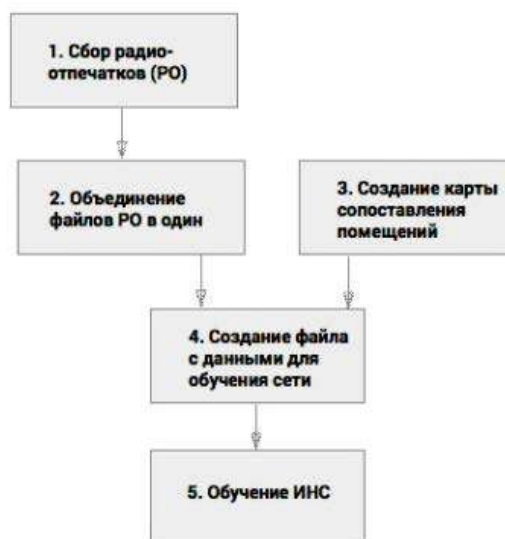
Рисунок 2 — Создание и обучение нейронной сети

Заключение. Учитывая отрицательные и положительные стороны построенных систем, можно говорить об основных задачах, которые будут ставиться перед разработчиком в дальнейшем. Таким образом, выбор подхода будет сводиться к начальным требованиям к системе. Если для системы не определены критерии расположения маячков, имеется достаточно времени для процесса настройки, а также требования к точности соотношены к определению помещения, то для реализации подойдет ИНС-модель. В других случаях предпочтительнее использовать модель шаблонов и графов.