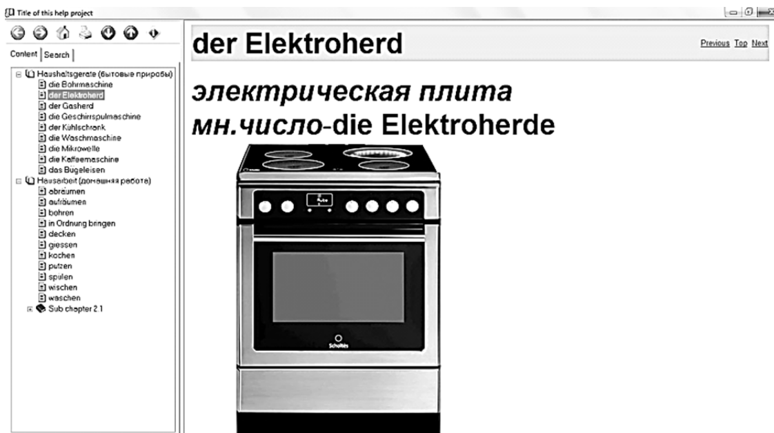
Рисунок 2 — Иллюстрация к имени существительному “der Elektroherd”