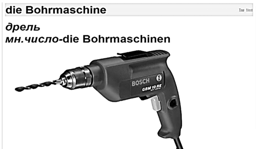
Рисунок 3 — Иллюстрация к имени существительному “die Bohrmaschine”

Заключение. Использование компьютерных технологий является достаточно эффективным методом преподавания и предоставляет возможность освободить учителя от значительной части рутинной работы (проверка выполнения отдельных упражнений, фронтальный опрос, предъявление большого объема языкового материала). Однако проблема использования обучающих компьютерных программ в преподавании иностранных языков является актуальной и требует дальнейшей разработки.