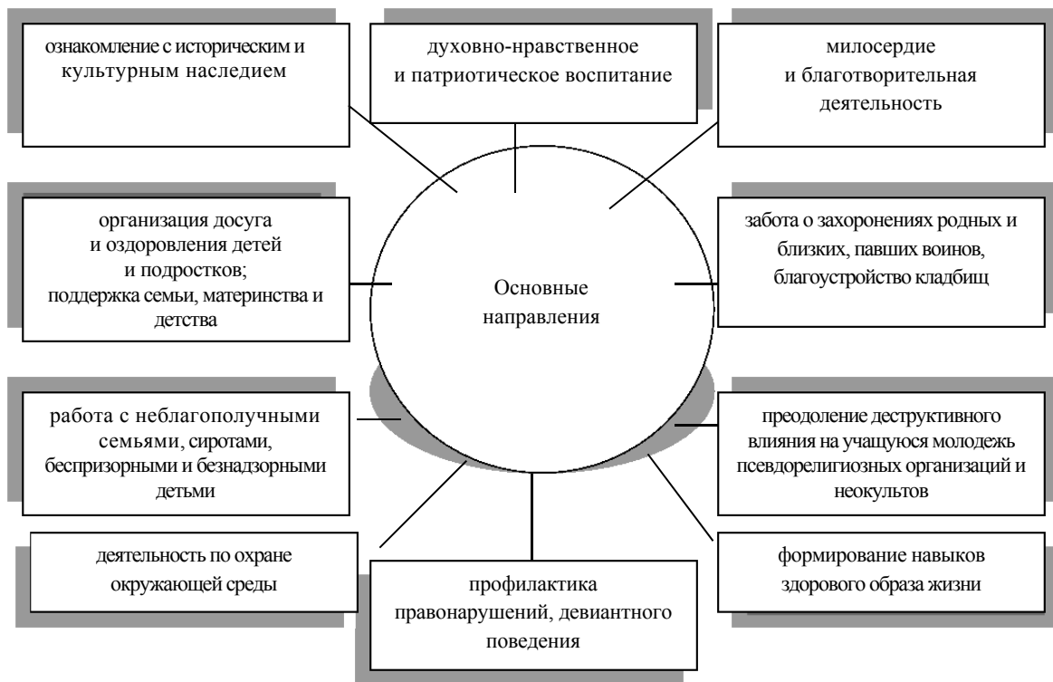
Рисунок 1 — Основные направления взаимодействия учреждений образования с православными благочиниями (приходами)