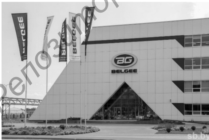
Рисунок 2 — Белорусско-китайское совместное предприятие СЗАО «БЕЛДЖИ» [6]

В области информационно-коммуникационных технологий Беларусь и Китай сотрудничают по таким направлениям, как развитие сетей передачи данных, создание программного обеспечения и баз данных, а также разработка стандартов и норм в сфере ИКТ. В частности, белорусские компании активно участвуют в реализации китайских проектов по созданию сетей 5G и развитию интернета вещей.