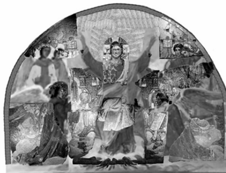
Рисунок 1 — Окончание