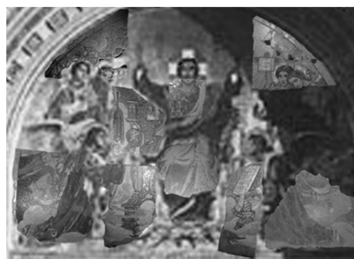
Рисунок 1 — Фрагменты панно «Господь Вседержитель на троне»