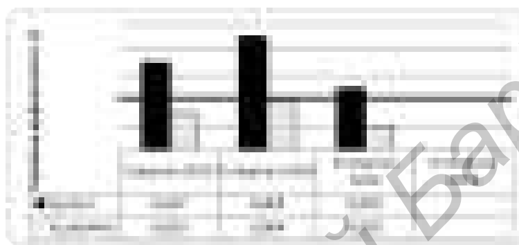
Рис. 6. Динамика изменения уровня дефектности закупаемой продукции Fig. 6. Dynamics of change in the level of defective products purchased

Таблицы отчетов направляются службой качества специалистам отдела закупок для расчета комплексной оценки поставщика по всем критериям оценки. Специалист отдела закупок, проанализировав данные из таблиц отчетов, присваивает каждому поставщику баллы за качество по результатам входного контроля с использованием бальной шкалы. На основании данных таблиц отчетов он проводит анализ динамики изменения качества закупаемой продукции в наглядной форме в виде столбиковой диаграммы (рис. 6).