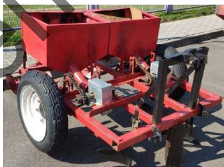
Рисунок 2 — Двухрядная роторно-ложечная картофелесажалка

Анализ существующих картофелесажалок показывает, что производители идут по пути применения ленточно-ложечных и цепочно-ложечных высаживающих аппаратов. Между тем рядом достоинств обладают высаживающие аппараты роторного типа: простота конструкции и малая металлоемкость.