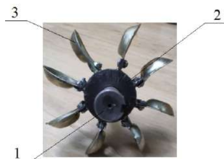
1 — вал; 2 — втулка; 3 — ложечки