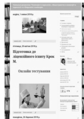
Рисунок 1. — Скриншот главной страницы дисциплинарного блога

С помощью персонального блога преподаватель обобщает и представляет свой педагогический опыт, систематизирует, архивирует значимый материал, осуществляет рефлексию своей педагогической деятельности.