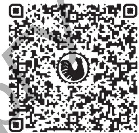
Рисунок 1. — Игровой комплекс «Моя Беларусь в дополненной реальности»

уровнях: общеобразовательном (знания об истории своей Родины, о достопримечательностях Республики Беларусь); профессиональном (знания об известных белорусских художниках Республики Беларусь, о музеях Республики Беларусь и др.); воспитательном (этикет и культура на занятиях по изобразительному искусству, умение работать в команде, правила общения с педагогом и сверстниками и др.); развивающем (стимулирование интереса к занятиям по изобразительному искусству, развитие творческого воображения, внимания, умения анализировать, мотивации в обучении и др.).