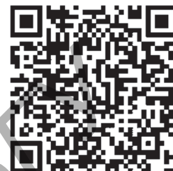
Рисунок 3. — Сайт электронного образовательного ресурса «Дополненная реальность»

Опыт апробации технологии в объединении по интересам изобразительной деятельности положен в основу разработки электронного образовательного ресурса «Дополненная реальность», который представляет собой комплекс программных средств, информационных, технических, нормативных и методических материалов, полнотекстовых электронных изданий, включая аудио- и видеоматериалы, иллюстративные материалы и каталоги электронных библиотек. Электронный образовательный ресурс доступен как на компьютерных носителях, так и в сети Интернет. Отсканировав QR-код, можно получить доступ к сайту электронного образовательного ресурса «Дополненная реальность» (рисунок 3).