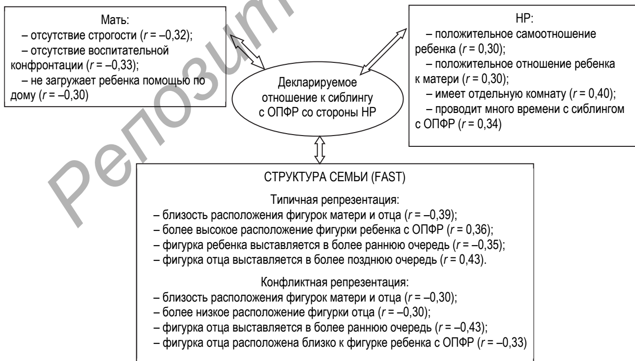
Рисунок 1. — Взаимосвязь параметров внутрисемейных отношений с декларируемым отношением НР к сиблингу с ОПФР

Результаты исследования и их обсуждение. Нормотипичный ребенок эмоционально вовлечен в жизнь сиблинга с ОПФР независимо от пола, возраста и порядка рождения. Значение имеет количество детей в семье: чем оно больше, тем меньше выражена эмоциональная связь между детьми. Декларируемое и реально переживаемое отношение НР к сиблингу с ОПФР не совпадают и связаны с разными сторонами жизни ребенка. Реально переживаемое отношение связано не с семейными процессами, а с внутренней позицией НР. Внешняя демонстрация положительного отношения к сиблингу с ОПФР является следствием лояльности к семье. При этом ребенок ориентируется на существующие в семье установки и стиль отношений внутри супружеской подсистемы (рисунок 1).