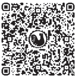
Рисунок 2. — Методические рекомендации по использованию приложений с технологией дополненной реальности