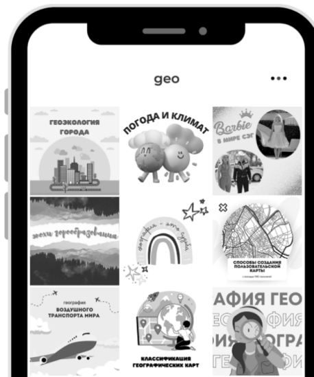
Рисунок 2 — Визуал аккаунта в Instagram