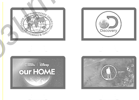
Рисунок 3 — YouTube-каналы для изучения географии. Составлено автором по [6]

Закключение. При использовании глобальной сети Интернет происходит формирование информационно-образовательной среды, которая позволяет в полной мере реализовать современные технологии обучения. В этих условиях тема использования социальных сетей как педагогического инструмента становится крайне актуальной. Социальные сети демонстрируют значительные преимущества для образования, включая доступность, интерактивность и возможность обмена знаниями и информацией на глобальном уровне. Они способствуют повышению мотивации студентов и облегчают процесс обучения за счет визуальных и мультимедийных ресурсов, что особенно важно в изучении географии. Использование социальных сетей позволяет студентам и преподавателям создавать образовательные сообщества, обмениваться опытом и участвовать в коллективных проектах.