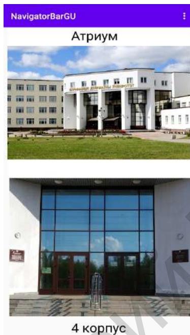
Рисунок 1 — Главная форма приложения

SDK (Software development kit) — это комплект для разработки программного обеспечения, который помогает разработчикам создавать приложения для конкретных платформ. Это могут быть компьютеры, игровые приставки или мобильные устройства[3]. Разработанное приложение позволяет пользователю получить маршрут к специализированным кабинетам Барановичского государственного университета. При запуске приложения отображается форма, изображенная на рисунке 1.