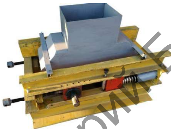
Рисунок 1 Вибровалковый измельчитель-активатор

Одной из наиболее перспективных областей использования вибровалкового измельчителя-активатора (рисунок 1) является переработка калийных удобрений. Основные закономерности при измельчении сильвинита описаны в работах [3–6].