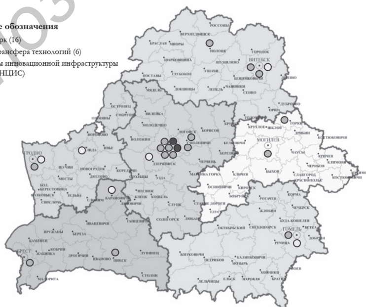
Рисунок 1. — Расположение субъектов инновационной инфраструктуры Республики Беларусь (по состоянию на 04.12.2023) [13]