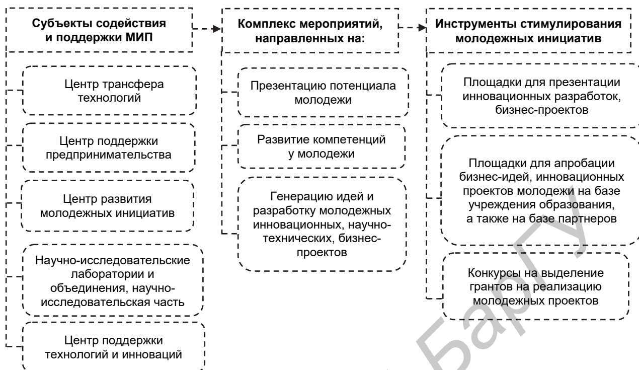
Рисунок 4. — Схема реализации молодежных проектов в сфере инновационного предпринимательства на примере БарГУ

Примечание — источник: собственная разработка.