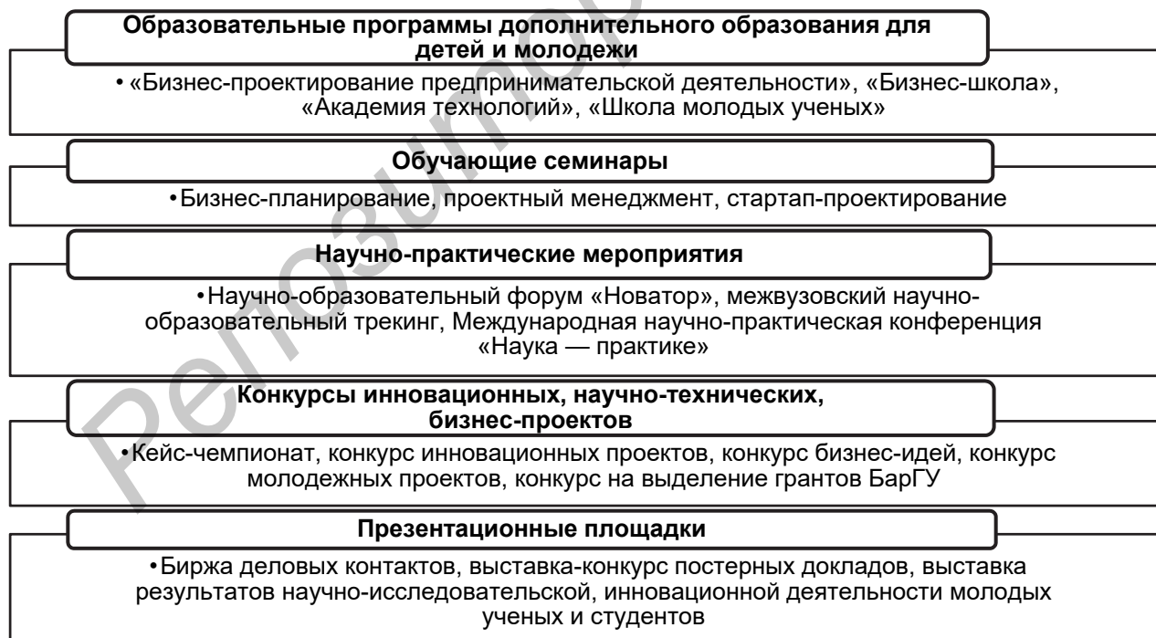
Рисунок 3. — Комплекс мероприятий по развитию компетенций у молодежи в сфере инновационного предпринимательства, проводимых БарГУ

Представим схему реализации молодежных проектов в сфере инновационного предпринимательства на примере БарГУ (рисунок 4).