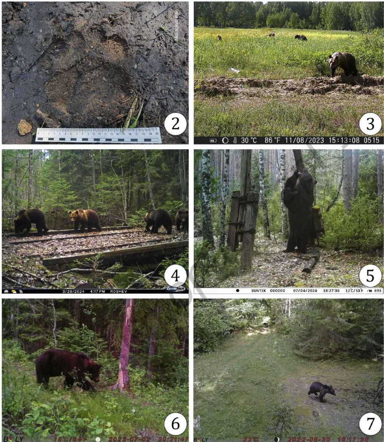
Рисунки 2—7. — Особи бурого медведя ( Ursus arctos ) и отпечаток пальмарной мозоли: 2 — отпечаток пальмарной мозоли крупного самца около д. Домжерицы; 3 — самка и три сеголетка на овсяном поле в ур. Пострежье; 4 — группа из четырех медвежат-второгодков; 5 — крупный самец в ур. Пострежье; 6 — крупный самец в ур. Красногубка; 7 — два медвежонка-второгодка