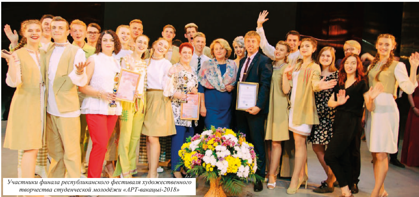
Участники финала республиканского фестиваля художественного творчества студенческой молодежи «АРТ-вакацыи-2018»