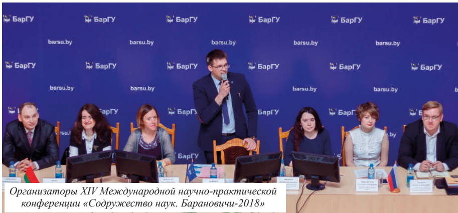
Организаторы XIV Международной научно-практической конференции «Содружество наук. Барановичи-2018»

В учреждении образования «Барановичский государственный университет» состоялась XIV Международная научно-практическая конференция молодых исследователей «Содружество наук. Барановичи-2018».