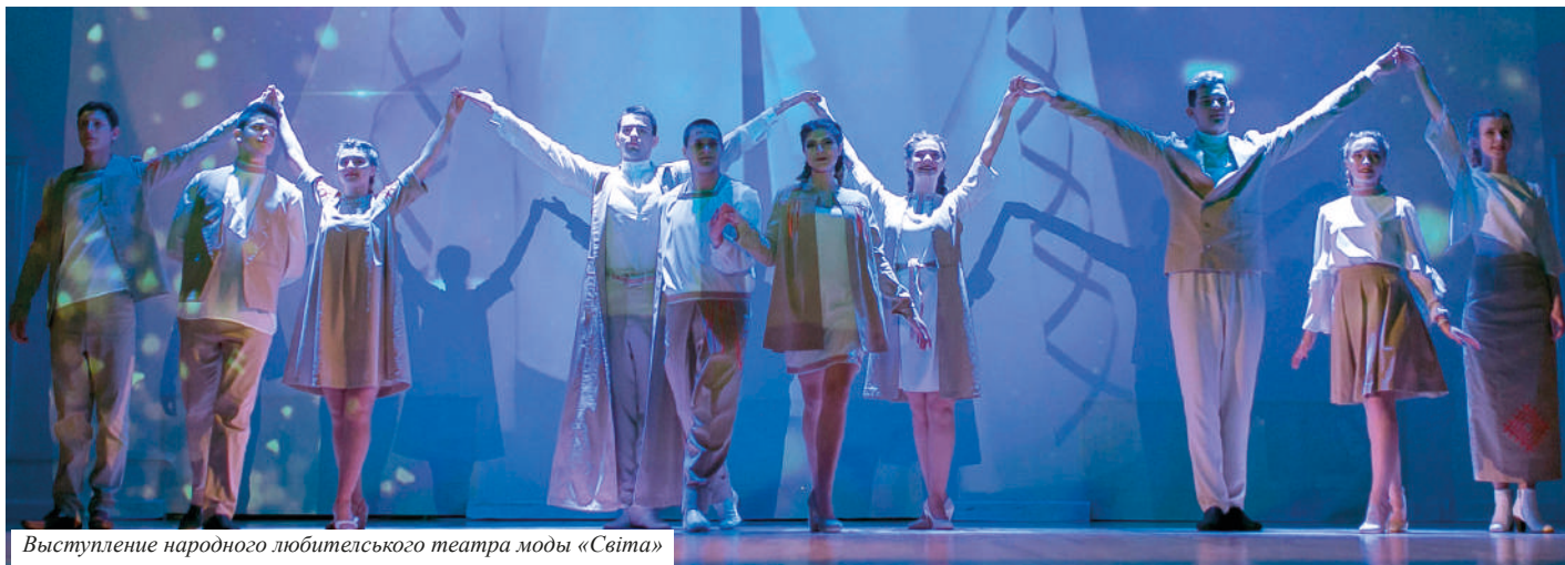
Выступление народного любительского театра моды «Світа»