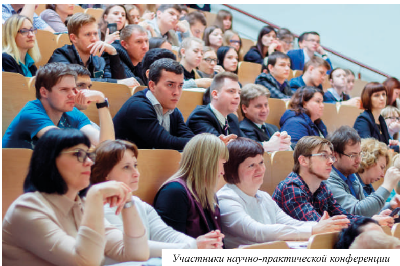
Участники научно-практической конференции

Результаты теоретических и практических исследований будут опубликованы в сборнике материалов научно-практической конференции. Приняты к публикации 312 тезисов докладов аспирантов, магистрантов, студентов, а также учащихся учреждений общего среднего образования Республики Беларусь, Российской Федерации, Украины.