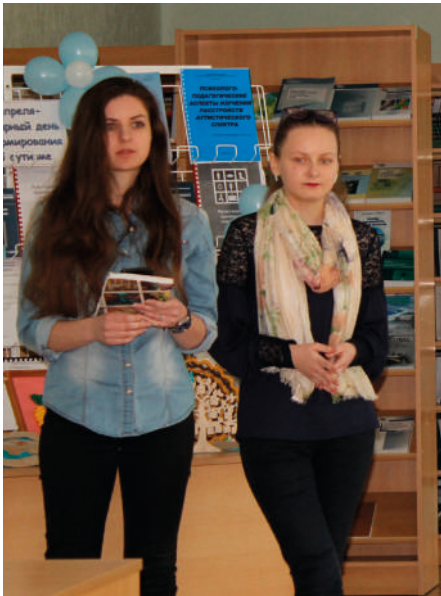
Выступление участниц информационной площадки

Мероприятия, посвящённые Всемирному дню информирования об аутизме, прошли в учреждении образования «Барановичский государственный университет».