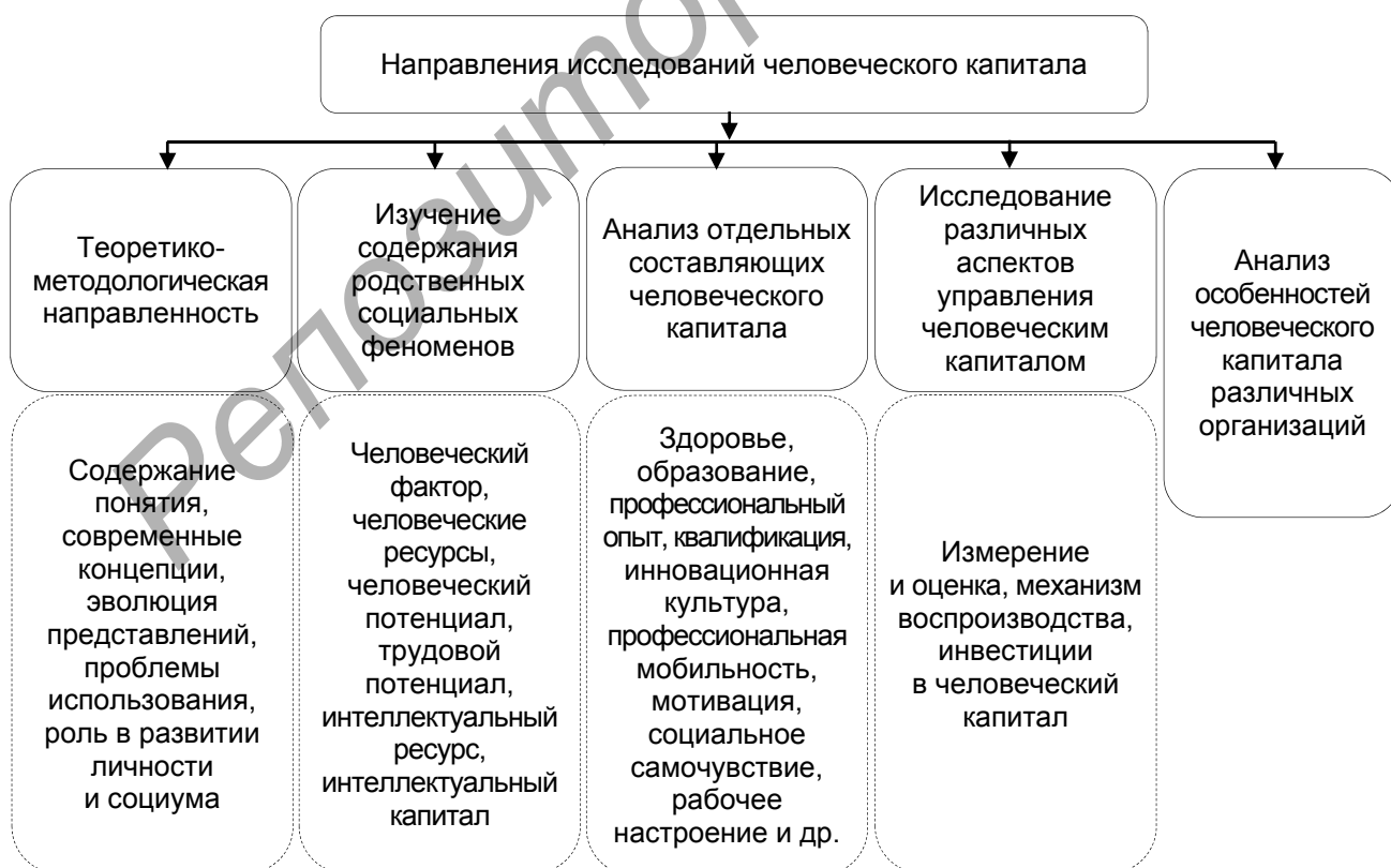
Рисунок 1. — Систематизация направлений исследования человеческого капитала

Примечание.