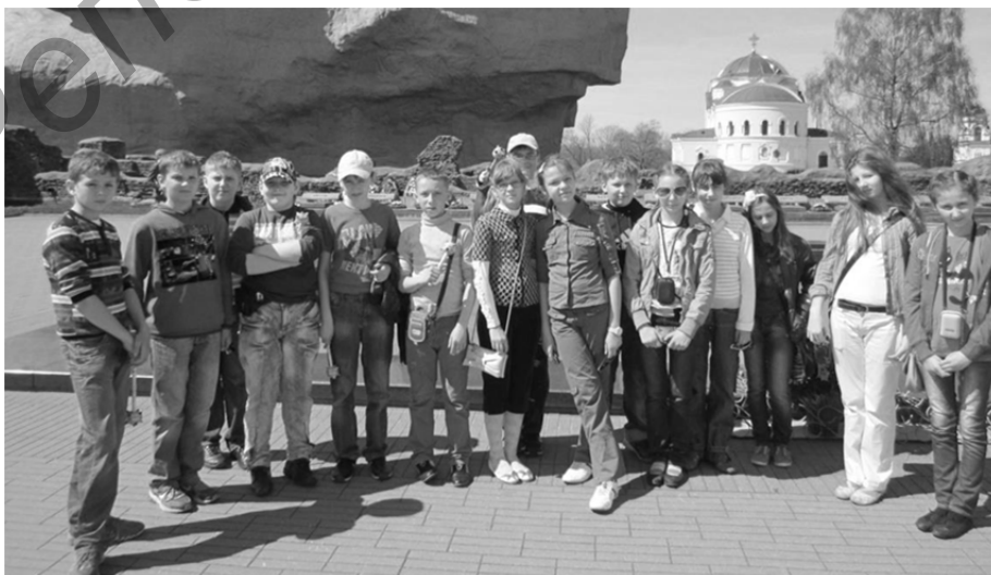
Рисунок 3 — Храм святителя Николая Чудотворца

Это лишь малая часть тех святых мест, где побывали наши ребята.