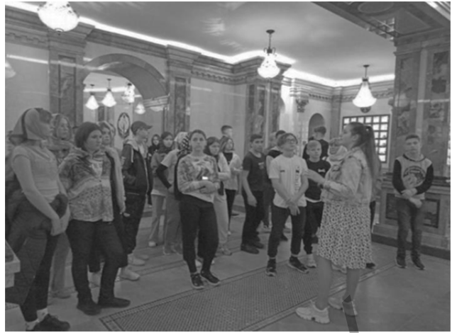
Рисунок 2 — Национальный мемориальный комплекс «Храм — памятник в честь всех святых и в память о жертвах спасению Отечества нашего послуживших»