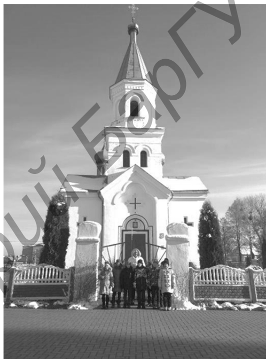
Рисунок 1 — Посещение учащихся Церкви Преображения Господня гп. Логишин

Заключение. Можно сделать вывод, что становление духовного человека в современном мире невозможно без правильного воспитания. «Воспитать» — значит способствовать формированию духовно-зрячего, сердечного и цельного человека с крепким характером. А для этого надо зажечь и раскалить в нём как можно раньше духовный «уголь», чуткость ко всему Божественному, волю к совершенству, радость любви и вкус к доброте. Поэтому именно Православие и духовно-нравственное воспитание детей и подростков, основанное на приобщении их к православным традициям, является приоритетным направлением работы школ, организационной и методической деятельности учреждений образования.