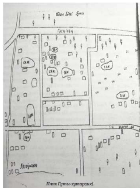
Рисунок 1 — План д. Гута