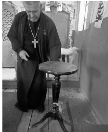
Рисунок 5 — Утварь часовни

Заключение. Данное исследование — это попытка в общих чертах рассмотреть историю возникновения и развития часовни Успения Пресвятой Богородицы с момента ее основания и до наших дней.