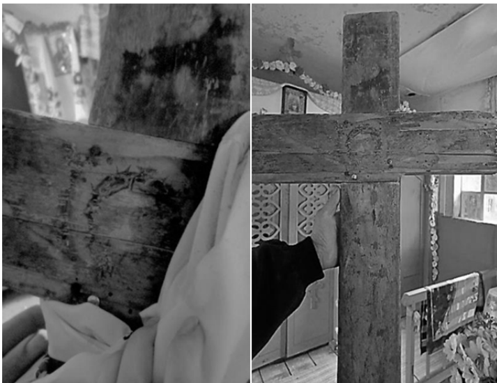
Рисунок 4 — Крест, который сохранился со времен открытия часовни