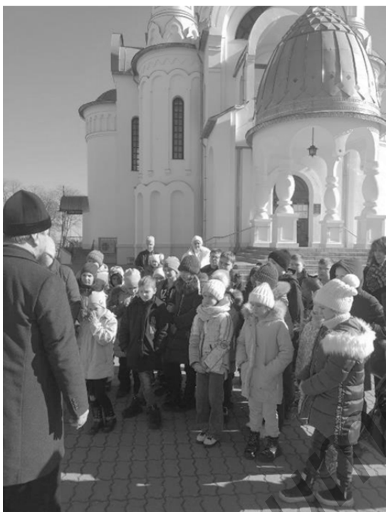
Рисунок 1 — Экскурсия учащихся в Духовно-патриотический комплекс города Берёзы

Регулярно учащиеся школы приобщаются к духовно-нравственному воспитанию и в повседневной жизни, педагоги и священство учат ребят добру, справедливости и милосердию, помогают учащимся познать связь культуры, народных традиций с православной верой.