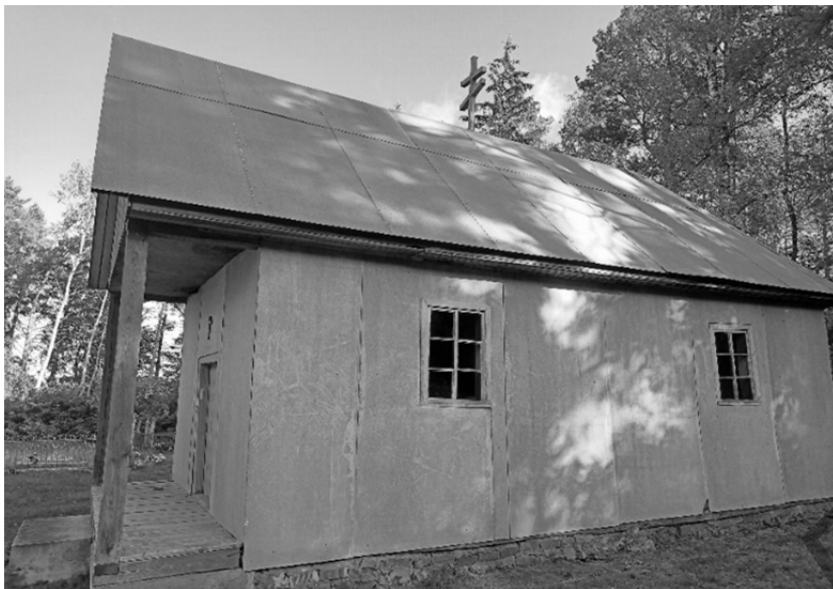
Рисунок 2 — Новый облик часовни

Как раз тогда умер отец Марии Ивановны. И когда настал их черед пасти коров — их корова вырвалась из стада и кинулась прямо на могилу к отцу и чуть было не откопала.