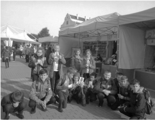
Рисунок 1 — Ежегодные православные фестивали в городе Пинске