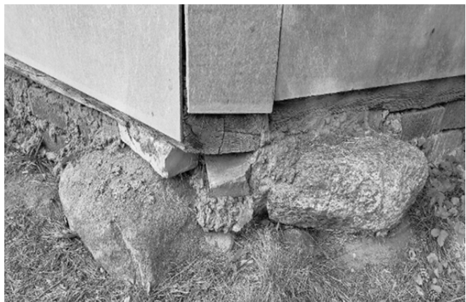
Рисунок 3 — Часовня на валунах

На сегодняшний момент убранство скудное, часовня нуждается в ремонте, но подтверждением тому, что она очень древняя, является еще и замок, который изготовили ковали. Каждый год на Успение 28 августа проходит служба, на которую съезжаются люди не только из района, но и из всех уголков Беларуси и ближнего Зарубежья.