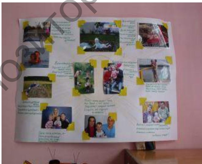
Рисунок 5 — Фотовыставка «Как мы отдыхаем»