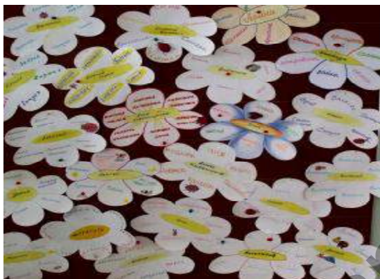
Рисунок 6 — «Полянка ромашек»

В е д у щ и й. Наша игра называется «Кто позвал?».