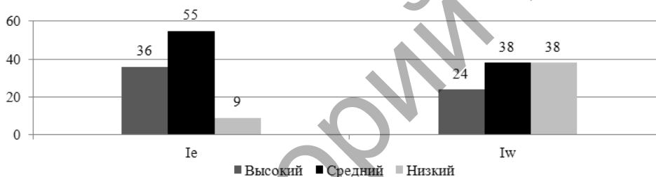
Рисунок 2 — Результаты исследования уровней «включения» в межличностных отношениях подростков с использованием методики ОМО А. А. Рукавишников

Средний уровень гармоничности отношений присущ большинству подростков (52 %). Межличностные отношения со сверстниками у них носят стабильный характер, предполагающий длительное сохранение взаимодействия в паре (группе), вызывающее положительные чувства, эмоциональный комфорт у партнеров (или в группе). Имеется стремление учитывать индивидуальные особенности друг друга. Отношения носят открытый, естественный характер.