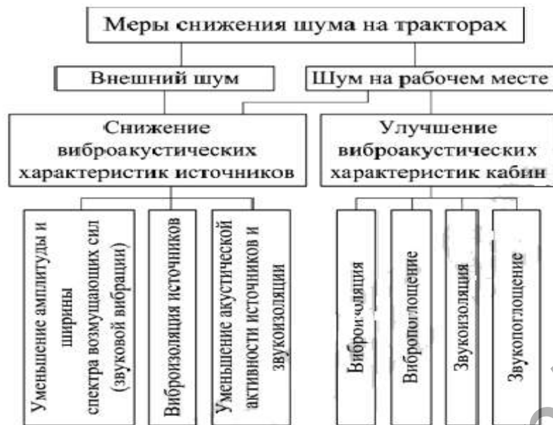
Рисунок 2 — Структурная схема мер снижения шума на рабочем месте оператора [9]

На кафедре управления охраной труда учреждения образования «Белорусский государственный аграрный технический университет» в результате проведенных исследований были разработаны новые конструкции глушителей аэродинамического шума, которые предложены к испытаниям в ОАО «Минский тракторный завод» [10].