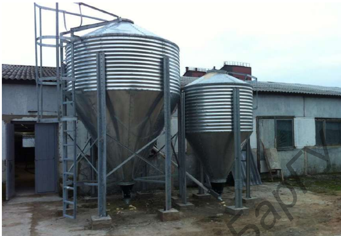
Рисунок 1 – Бункеры для хранения комбикормов