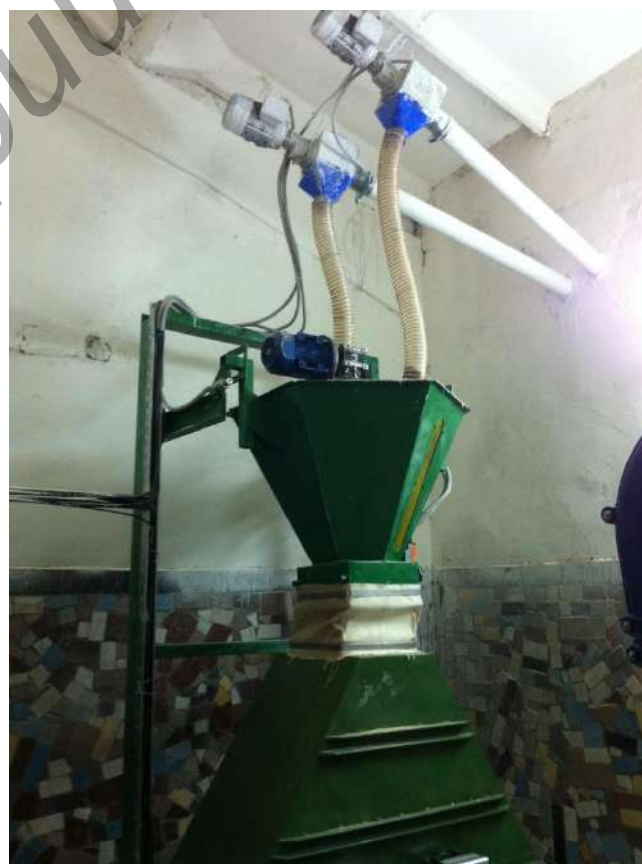
Рисунок 2 – Смеситель кормов