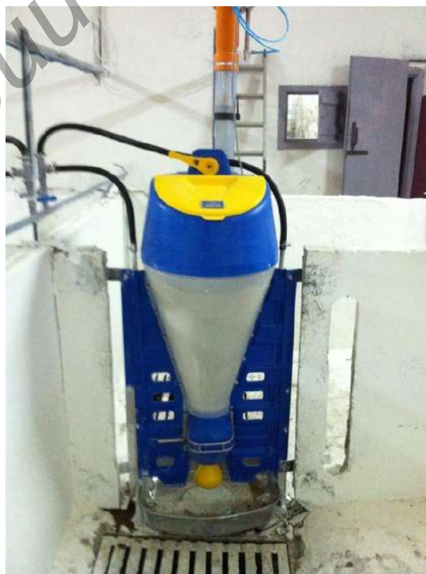
Рисунок 3 – Линия раздачи кормов