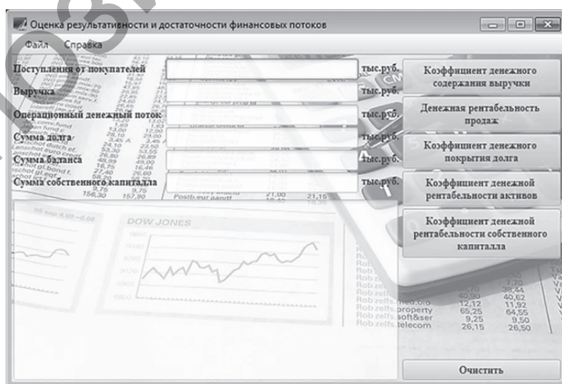
Рисунок 1 — Приложение для оценки результативности и достаточности финансовых потоков

Предлагается использовать систему таких показателей, как коэффициент денежного содержания выручки, показатель денежной рентабельности продаж, коэффициент денежного покрытия долга, коэффициент денежной рентабельности активов и коэффициент денежной рентабельности собственного капитала.