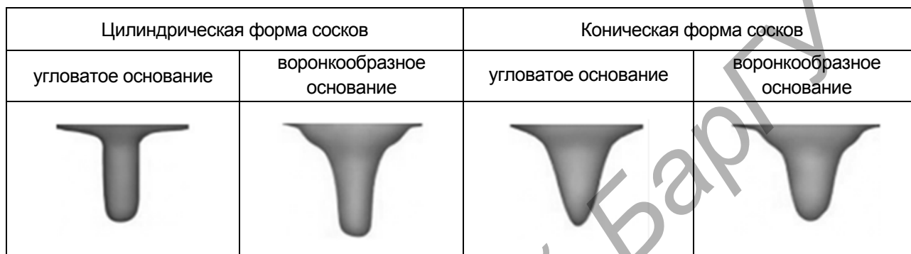
Рисунок 3. — Формы сосков у коров

Особенно важно учитывать условие сжатия соска вымени коровы, поскольку соски изменяются с ее возрастом и имеют различную форму (рисунок 3) [2; 3].