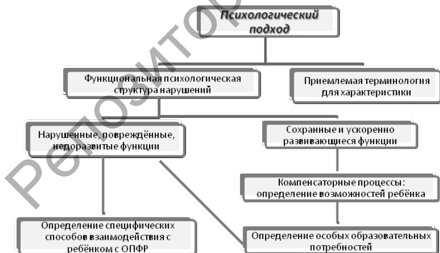
Рисунок 1 — Теоретическая модель психологической характеристики обучающихся с ОПФР

Данная систематизация позволила составить комплексные психолого-педагогические характеристики детей с разными видами нарушений развития, которые будут получать образование в инклюзивной школе. Полагаем, что педагог-психолог учреждения инклюзивного образования при выполнении своей профессиональной деятельности, ознакомившись с такими характеристиками, будет ориентирован на позитивные возможности ребёнка при взаимодействии с ним. Определяя профессиональные функции педагога-психолога в учреждении инклюзивного образования, следует подчеркнуть, что педагог-психолог должен уметь выделять детей с ОПФР по специфическим признакам, определять их специфические образовательные потребности, реализовывать продуктивные способы взаимодействия с ними, выявлять и развивать их сильные стороны.