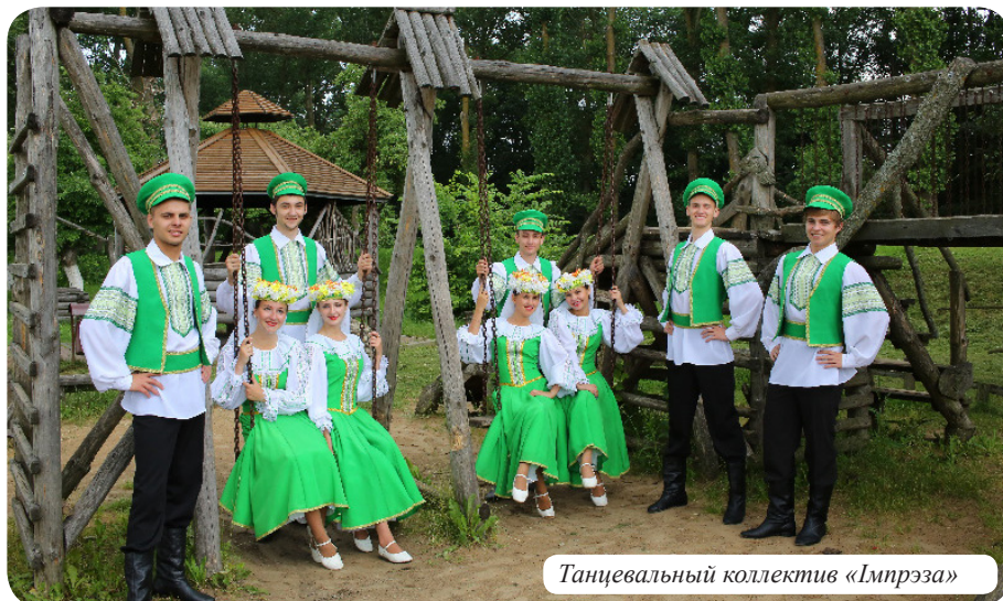
Танцевальный коллектив «Імпрэза»

В университете функционируют многочисленные спортивные секции и группы здоровья: армрестлинг, атлетическая гимнастика, баскетбол, волейбол, восточные танцы, гиревой спорт, дзюдо/самбо, йога, лёгкая атлетика, мини-футбол, ориентирование спортивное, плавание, теннис, теннис настольный, туризм.