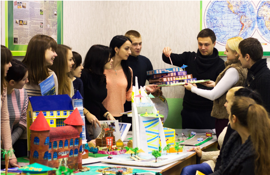
Занятие в студенческой лаборатории «Ориентир»

Факультет экономики и права готовит специалистов, способных компетентно и эффективно осуществлять практическую деятельность в сферах экономики и менеджмента организации, маркетинга, бухгалтерского учёта и аудита, правоведения, сервиса и туризма.