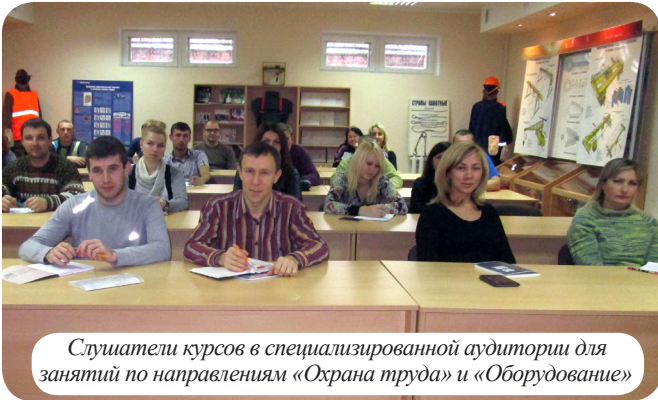
Слушатели курсов в специализированной аудитории для занятий по направлениям «Охрана труда» и «Оборудование»