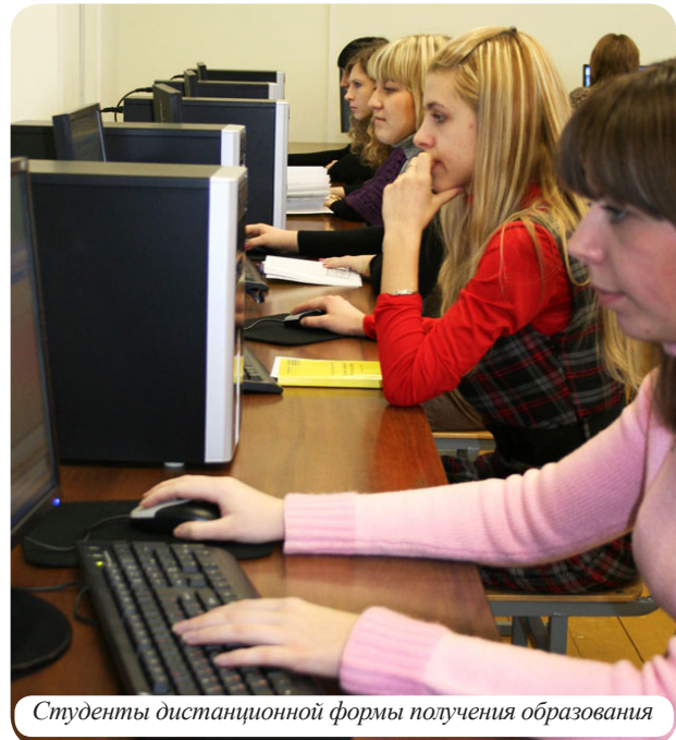
Студенты дистанционной формы получения образования