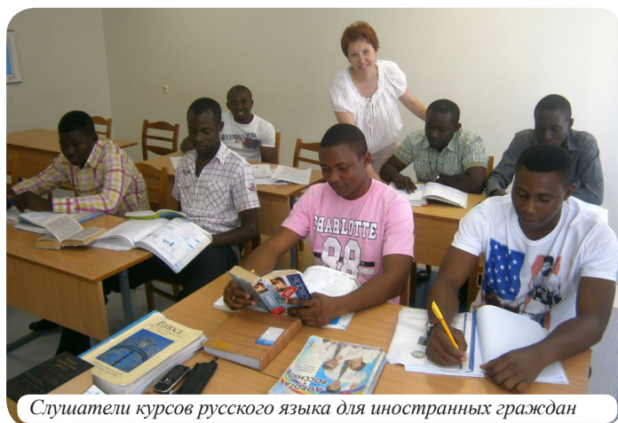
Слушатели курсов русского языка для иностранных граждан

Эффективности работы факультета во многом способствует тесное взаимодействие с лицеем, гимназиями, школами и колледжами города Барановичи. Конечным итогом работы факультета является качественная подготовка будущих абитуриентов ко вступительным испытаниям. В результате подавляющее большинство выпускников факультета становятся студентами БарГУ и других учреждений высшего образования нашей Республики Беларусь.