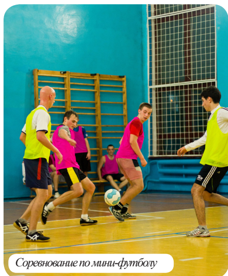
Сорэвнованне па міні-футболу