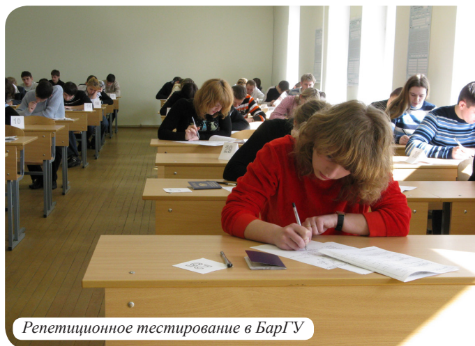
Репетиционное тестирование в БарГУ

Тел./факс 8 (0163) 45-87-99, fdp@barsu.by