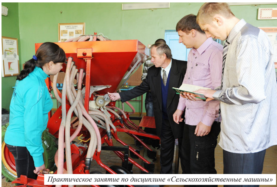
Практическое занятие по дисциплине «Сельскохозяйственные машины»

Распределение на работу ежегодно получают все студенты, обучавшиеся на бюджетной