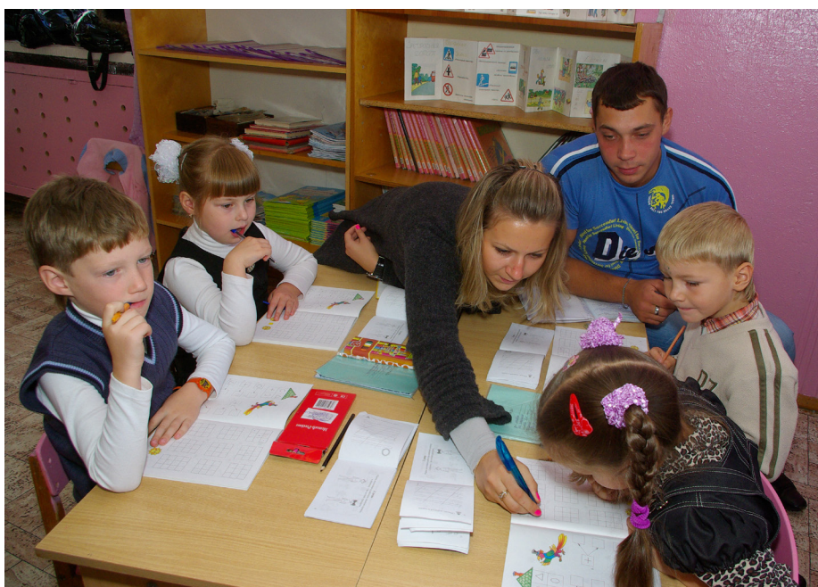
Работа филиала кафедры дошкольного образования

Получение высшего педагогического образования предусматривает практическую подготовку. Ежегодно студенты факультета проходят учебные и производственные практики